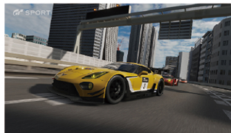
PlayStation®4用ソフト『グランツーリスモSPORT』 Gran Turismo SPORT: TM & © Sony Interactive Entertainment Inc.

■日時:9月18日(月・祝) 13時30分～16時 ■定員:30名 ■費用:無料